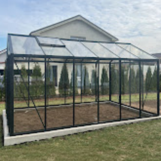
Classic Premium 146.jpeg 874K