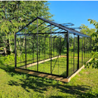
Classic Premium 76.jpg 1358K