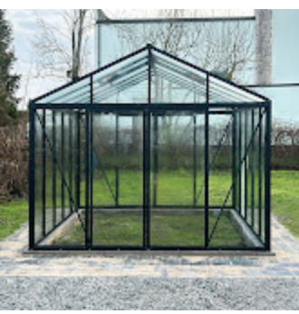
Classic Premium 50.jpeg 541K