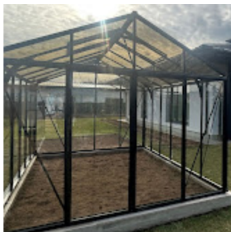
Classic Premium 143.jpg 957K