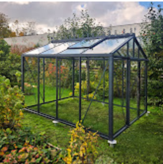
Classic Premium 126.jpg 1416K