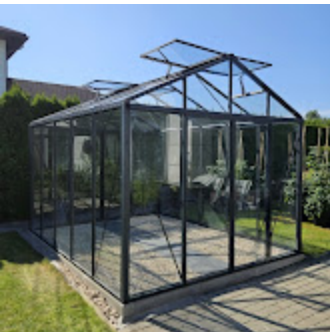
Classic Premium Dark Grey 01.jpeg 1152K