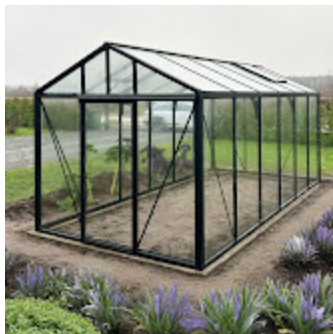
Classic Premium 45.jpeg 728K